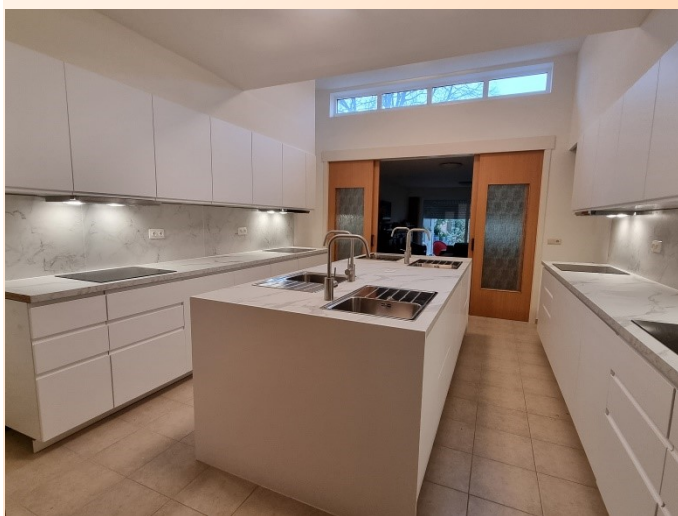
De splinternieuwe keuken

Wij danken alvast iedereen die reeds bijgedragen heeft om dit mee mogelijk te maken. Natuurlijk kunnen we nog een financieel duwtje goed gebruiken om de keukens verder in te richten!